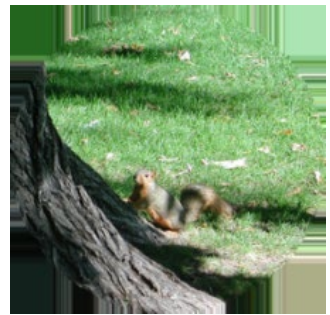
キャンパス内のリス