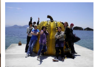
直島フィールドワーク