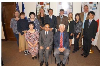
デンバー総領事も同席しての調印式