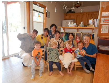
託児施設での活動

コロラド州立大学理学科、人文学科との共同研究の推進、幼児教育センターでの教育実習を含む学生交流、Fort Collins市内の小中学校ならびに教育学部附属学園での授業実施を含む交流活動、高松市役所、香川県庁の訪問など様々な交流活動が活発になされている。