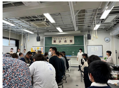
CSUと附属坂出中学校生徒保護者との交流活動